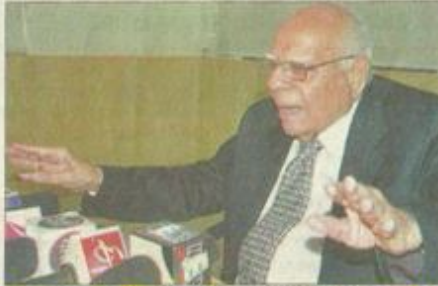
नोएडा स्थित सिविलियंस लॉ स्कूल मंगलवार को आयोजित कार्यक्रम के कार्यक्रम में संबोधित करते पूर्व कानून एवं न्याय मंत्री राम जेटमलानी।

एडवोकेट जेटमलानी मंगलवार को सिविलियंस लॉ स्कूल नोएडा के कार्यक्रम में शामिल हुए। उन्होंने छात्रों से अन्ना के समर्थन का आह्वान किया। राम जेटमलानी ने बताया कि इस समय देश का 1500 मिलियन डॉलर भ्रष्टाचारी राजनेताओं ने देश के बाहर पहुंचाया हुआ है, जिसके लिए उन्होंने सिटीजन ऑफ इंडिया ग्रुप के तहत सुप्रीम कोर्ट में याचिका दायरी हुई है। पत्रकारों से बातचीत में बरिष्ठ अधिवक्ता जेटमलानी के कहा कि अन्ना हजारों का जीवन देश के लिए अमूल्य है और उसे बचाने के लिए